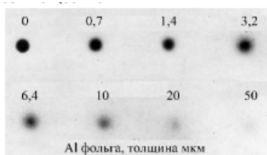
Рис. 1. Рассеяние β-лучей по Г. Хевеши

Через несколько лет после открытия А. Беккерелем радиоактивности был установлен сложный состав радиоактивного излучения, одна из компонент которого получила название «β-лучи». Исторически под β-лучами понимали потоки электронов, появляющиеся в результате радиоактивного распада ядер атомов, причём скорости их могут составлять до 99% от скорости света. Они обладают и относительно большой кинетической энергией.