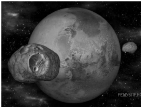
Рис. 1. Спутники Марса

Спутники искусственного происхождения, или, как их ещё называют, искусственные спутники, — это космические аппараты, созданные людьми, позволяющие наблюдать из космоса за планетой, около которой они обращаются, а также за другими астрономическими объектами. Обычно искусственные спутники используются для наблюдений за погодой, изменениями рельефа поверхности планеты, для теле- и радиотрансляции, а также для проведения длительных экспериментов в условиях невесомости (рис. 2).